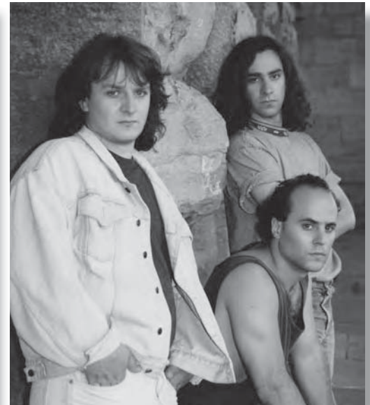
Brasse-Camarade, 1990.

L'Assemblée des centres culturels de l'Ontario (ACCO) , fondée en 1978 à Toronto, dont les objectifs sont : « regrouper les centres culturels existants; seconder les centres culturels en voie de formation ; servir de centre de ressources et d'information; maintenir des liens de collaboration et d'information entre ses centres; seconder, favoriser et promouvoir au profit des centres culturels franco-ontariens [...] le développement et la promotion de toutes activités culturelles 2 . » L'ACCO représente les centres culturels auprès du gouvernement et desservait 23 organismes membres en 1997. Le fonds témoigne des principales activités de l'ACCO depuis sa fondation. Il comprend, entre autres documents, le manuscrit du rapport intitulé Onze centres culturels franco-ontariens, éléments de trajectoire et d'horizon , par Pierre Pelletier (1979); de la correspondance et des documents promotionnels d'artistes et d'organismes culturels; de la documentation sur les centres