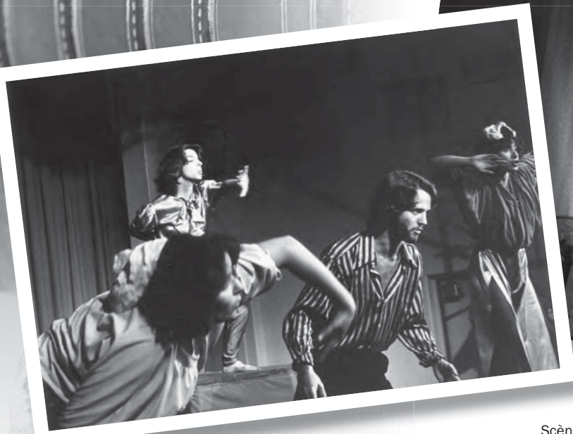
Scène de la pièce La parole et la loi , création collective du Théâtre d'La Corvée, 1977.