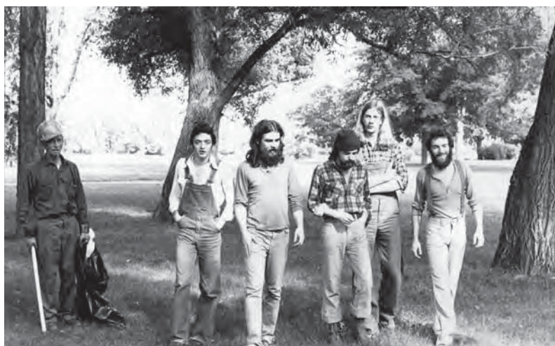
Le groupe musical franco-ontarien 33 Barette, [197-?]. Université d'Ottawa, CRCCF, Fonds Association canadienne-française de l'Ontario (C2), Ph2-278.

des activités de l'Association; des documents sonores, vidéocassettes, films et quelque 191 documents particuliers comme des affiches, des cartes, des dessins (techniques et architecturaux) et des gravures.