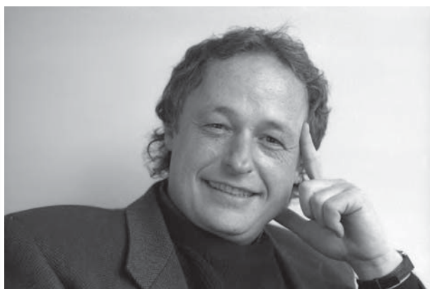
Daniel Poliquin, auteur, Ottawa, 9 novembre 1994.

Depuis les 40 dernières années, les institutions culturelles se sont multipliées et diversifiées pour englober un nombre toujours croissant de champs d'activité. Aujourd'hui, les créateurs franco-ontariens s'expriment plus que jamais auparavant par le truchement de la littérature, de la musique, du théâtre et des arts visuels.