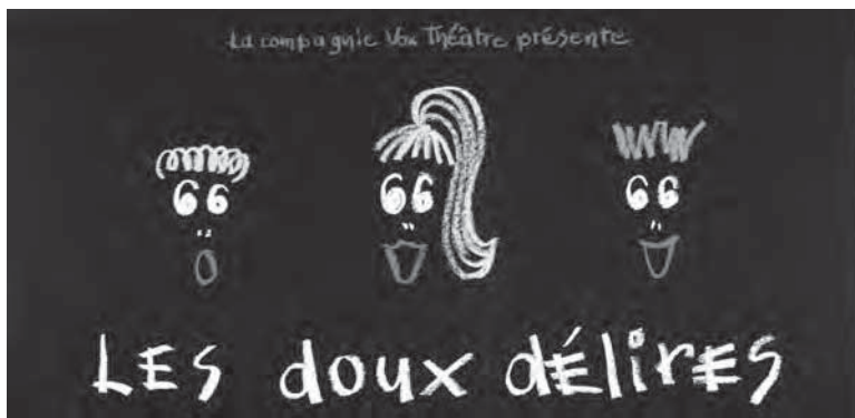
Affiche de la pièce Les doux délires , présentée par la Compagnie Vox Théâtre, Ottawa, 1989. Université d'Ottawa, CRCCF, Fonds Festival franco-ontarien (C90), M97.127.

même but que la société 4 ». Puis en 1992, « favoriser l'épanouissement culturel au sein des communautés culturelles canadiennes-françaises; promouvoir la création des artistes de la francophonie en provenance de ces communautés; assurer que les institutions et les agences publiques nationales répondent de façon adéquate aux besoins de développement culturel et artistique de ces communautés; organisation de rencontres des artistes et des diffuseurs de produits culturels; revendications et démarchage auprès des instances politiques; soutien aux organismes provinciaux et territoriaux; appui au développement culturel communautaire 5 ». La FCCF regroupe 13 associations culturelles provinciales et territoriales ainsi que sept regroupements artistiques nationaux représentant le théâtre, les arts visuels, la chanson et la musique, l'édition et les arts médiatiques 6 . Le fonds témoigne des activités de la FCCF depuis sa fondation en 1977 et est subdivisé en deux grandes séries : Comité culturel des francophones hors Québec et Fédération culturelle des Canadiens