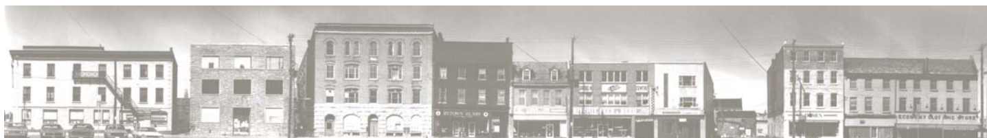
[Rue York, Marché By, Ottawa], [197?]. Photographie : n & b ; 29 cm x 7,5 cm (Université d’Ottawa, CRCCF, Fonds Jean-Robert-Gauthier (P348), Ph268-1 / 848).

Un ouvrage fera une analyse des enjeux soulevés par la transformation de la francophonie d’Ottawa, dans ce « moment » charnière qu’ont été les années 1960-1980. Le livre comprendra un retour sur la période antérieure ainsi qu’une réflexion sur les réalités d’aujourd’hui. L’ouvrage contiendra une douzaine de chapitres, rédigés par autant d’auteurs. Des propositions de chapitre ont été présentées et discutées le 3 septembre 2013. Hélène Beauchamp, Pierre