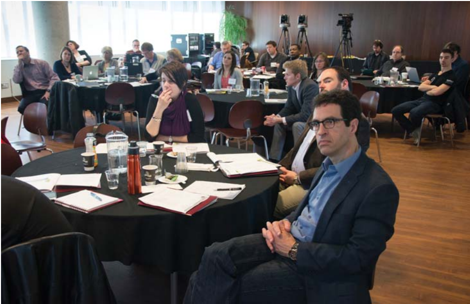
Une partie des participants au colloque La francophonie au travail, 11 avril 2014.