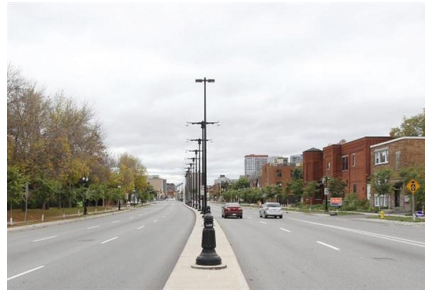
La rue King-Edward aujourd'hui