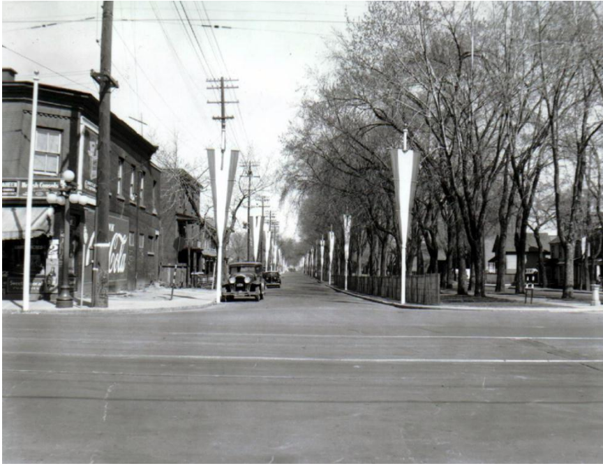
Intersection des rues King-Edward et Rideau, avant 1940