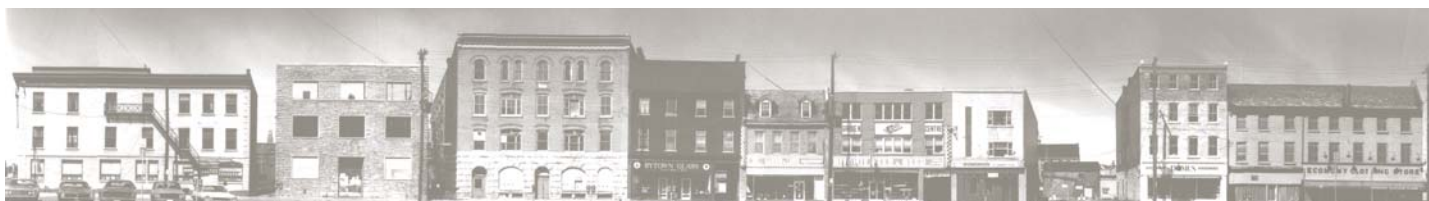
[Rue York, Marché By, Ottawa], [197?]. Photographie : n & b ; 29 cm x 7,5 cm.