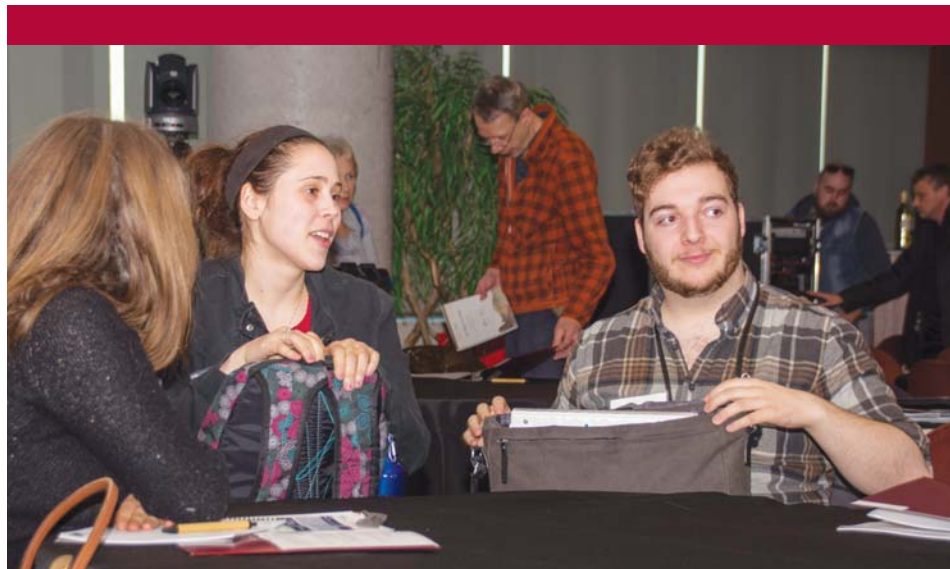
Photo prise lors du colloque Les Pays d'en haut , 18 mars 2015 (photo : Daniel Dostie).

Le CRCCF enrichit l'expérience étudiante dans les divers domaines qui sont les siens : la recherche, l'initiation à l'archivistique, la diffusion des savoirs, en mettant un place plusieurs initiatives : la sensibilisation des étudiants de diverses disciplines aux enjeux entourant la recherche documentaire, la formation en archivistique, les assistanats de recherche, les bourses de recherche, le colloque étudiant bisannuel. Son équipe d'archivistes appuie les étudiants dans leurs travaux de recherche et son équipe de