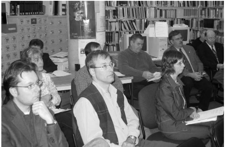
Des membres de l'Assemblée des chercheurs lors de la présentation du Rapport annuel 2003-2004.

Puis, le directeur a souligné que l'année 2003-2004 a été faste sur le plan de la fréquentation du Centre et de son site Web (des nombres record : 1 826 chercheurs en salle, dont 50 p. 100 sont des professeurs et des étudiants de l'Université d'Ottawa, 159 207 visites sur notre site Web); sur le plan des subventions de recherche (près de 500 000 $); des publications (revues Francophonies d'Amérique et L'Annuaire théâtral, Bulletin , articles, livres – le plus récent étant les actes du colloque « Itinéraires de la poésie. Enjeux actuels en Acadie et en Ontario et dans l'Ouest